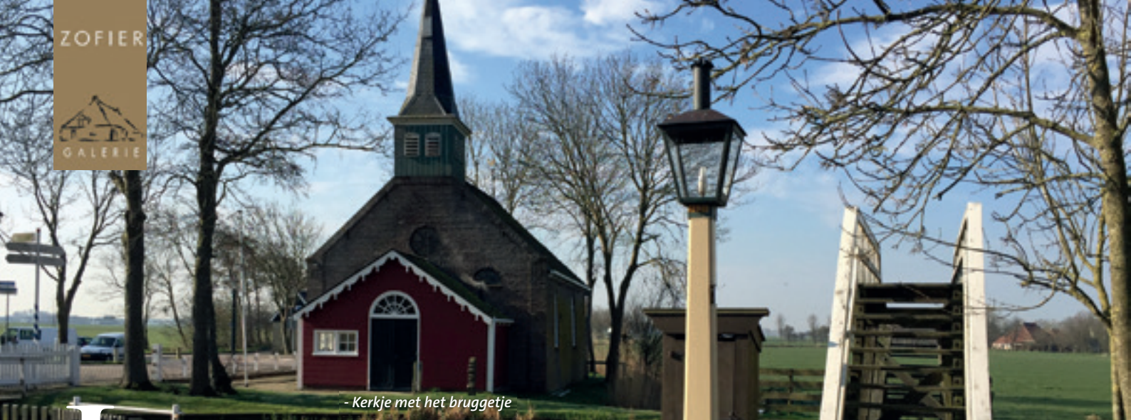
- Kerkje met het bruggetje