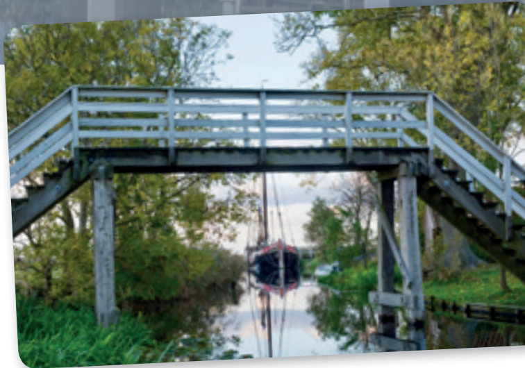
- Het witte bruggetje

Voor elke expositie creëert een aantal kunstenaars nieuw werk, geïnspireerd op thema's die aansluiten bij het museumdorp. ZoFier heeft een uitgebreide groep van circa veertig vaste kunstenaars die aan deze tentoonstellingen deelneemt. Regelmatig worden er ook gastkunstenaars uitgenodigd om mee te doen.