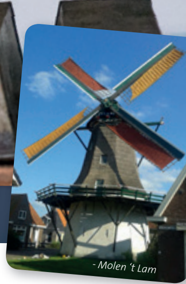
- Molen 't Lam