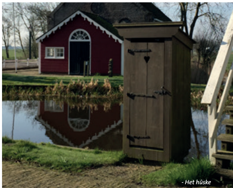
- Het hûske

Het rioleringsstelsel, dat al werd uitgevonden door de Romeinen, is in Nederland nog maar 100 jaar oud. In Allingawier stond het hûske aan de vaart. Neem een kijkje in het wc-huisje om te zien hoe het rioleringsstelsel van deze Friezen eruitzag.