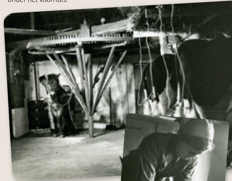
- Karnmolen in de Izeren Ko

De dagelijkse arbeid van de boerin was het verwerken van zuivel. Ze bewaarde de verse melk in zeven koperen aden. De room die kwam bovendrijven werd er dagelijks afgeschepd en in de karnton gegoten. Deze heeft u al in het zomerverblijf kunnen zien. Het karnmechanisme werd in beweging gebracht door een klein paard of “Kedde” dat rond de molen op de deel liep. Na het karnen werd de boter in de boteraad gekneet om het laatste restje vocht eruit te krijgen, en gezouten. Dit gebeurde in de melkkelder onder het voorhuis.