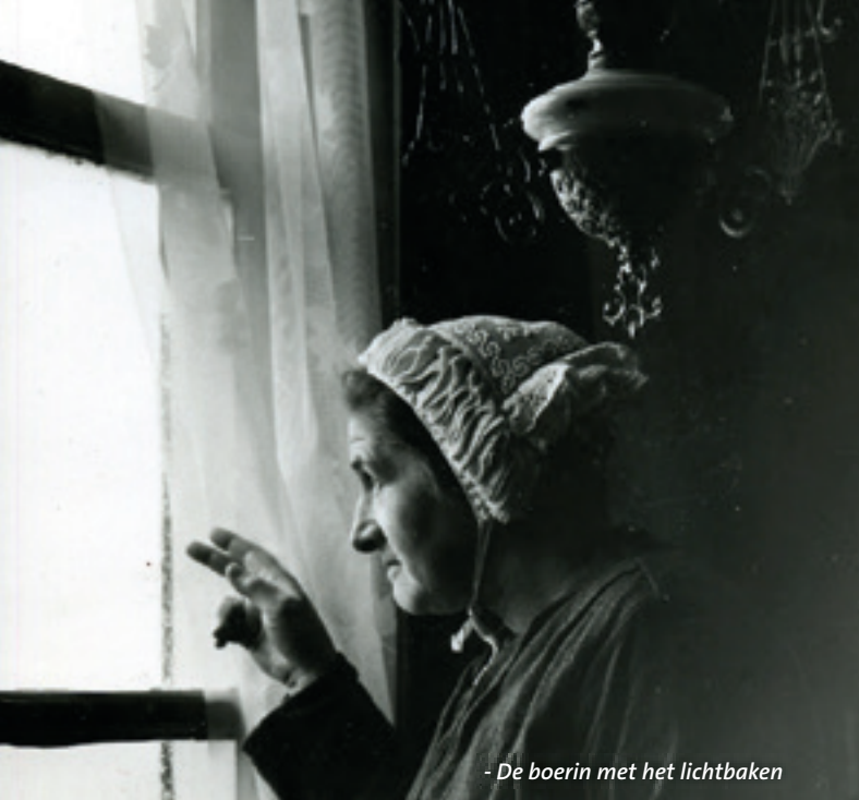
- De boerin met het lichtbaken