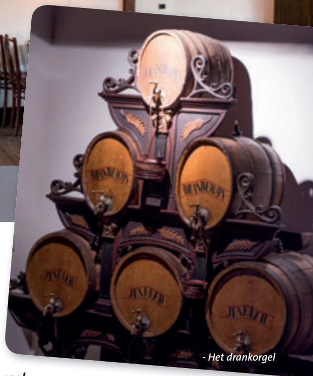
- Het drankorgel

Het café heeft ook een “achterzaaltje”. Dit zaaltje werd vroeger voor allerlei doeleinden gebruikt; van feestjes en vergaderingen tot toneelvoorstellingen en repetities van het plaatselijke muziekkorps. Ook werden hier door de dorpsbewoners “snode plannen” uitgedacht. Kortom, een zeer belangrijke ontmoetingsplaats.