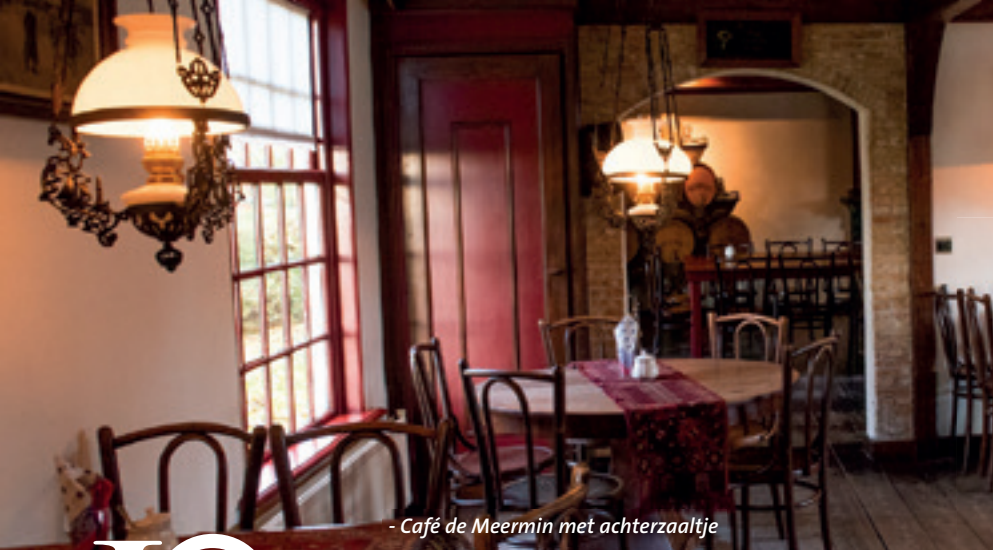
- Café de Meermin met achterzaaltje