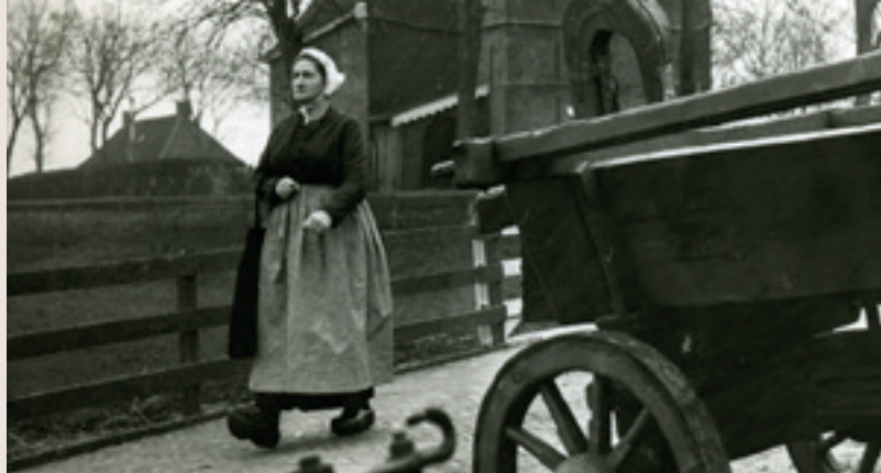
- Dame in klederdracht

"Daar staat hij. Het Friese paard. Fier. Sterk. Intelligent. Ietwat verheven. Alsof hij zich bewust is van de eeuwen die zijn voorouders hebben afgelegd. Alsof hij zich bewust is van de plek die hij inneemt in zovele harten."