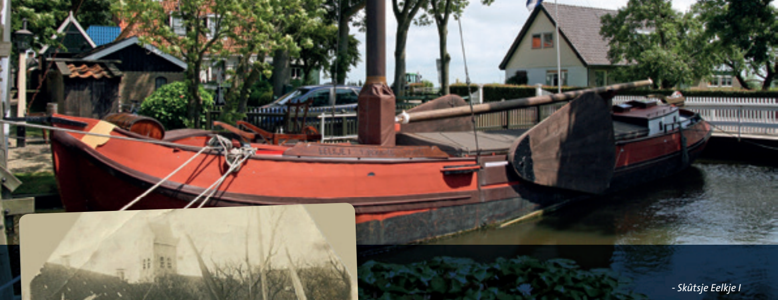
- Skûtsje Eelkje I