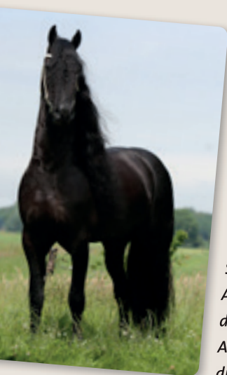
- Friese hengst Tsjalle.

Vroeger werd de Friese sjees ook gebruikt voor de lokale drafsport. Vandaag de dag wordt de sjees nog gebruikt om er folkloristische shows en wedstrijden mee te rijden. Er lopen dan uiteraard Friese paarden voor. Bij het optuigen van de paarden worden hoofdstellen met rijkversierde oogkleppen, bijpassende schoftstukken en borsttuigen gebruikt. De paarden moeten tijdens het lopen goed 'tuigen', dat wil zeggen: statig stappen en ruim draven met fier geheven hoofden en hoge knieactie.