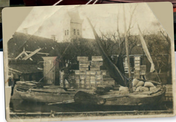
- Museumhaven Allingawier 1920