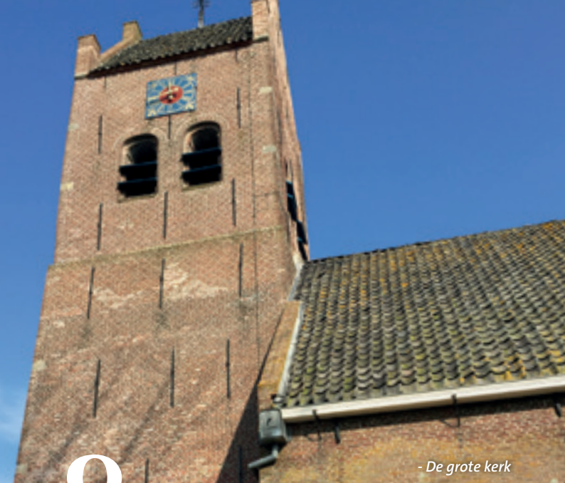
- De grote kerk