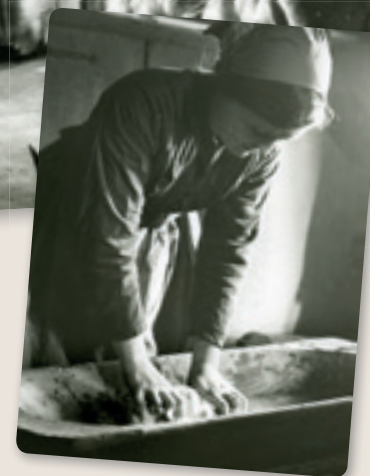
- het maken van de boter